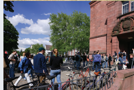
Impressum: Philologische Fakultät der Universität Freiburg. Fotos: H. Kubowitz, M. Spiegelhalter. Stand: August 2006

Wenn Sie weitere Fragen zu einem der Fächer haben, besuchen Sie bitte die jeweilige Internetseite. Dort sind kompetente Ansprechpersonen genannt.